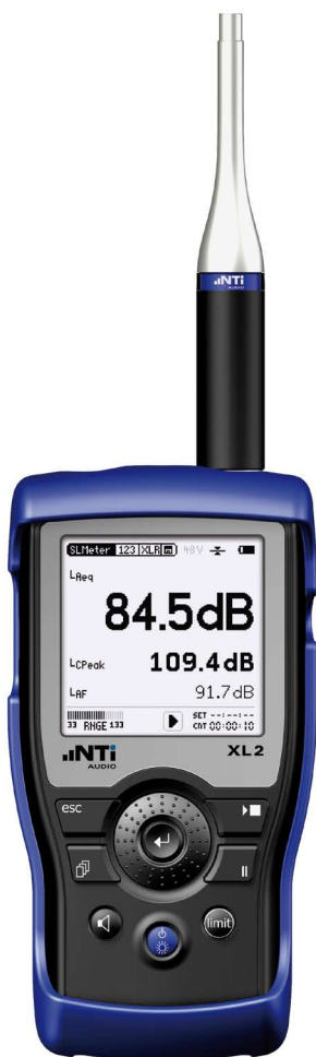
XL2 及 M4260 量测麦克风

若导入一个测试信号（如粉噪声），则所有的5个扬声器应该产生几乎相同的声压级（至少在100-10kHz范围内要满足），彼此的偏差在 \pm 0.5 dB内。低音扬声器在20到120 Hz范围内的声压级应该在比其他通道高10dB。这个“带增益”（见图纸）被家庭影院系统接收机收到后可以将低频信号的声能与其他5通道一致。