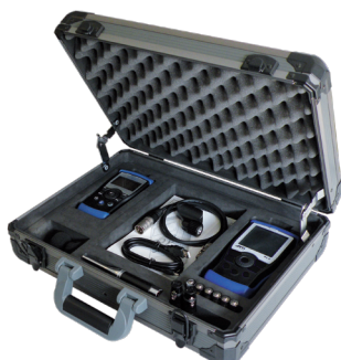
Exelアコースティックセット