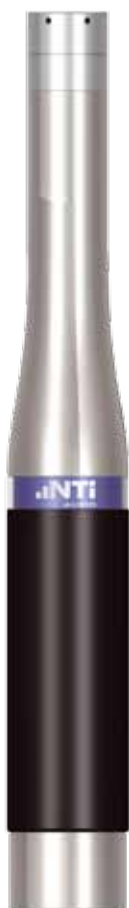
MA220 量测麦克风前置放大器