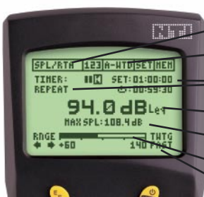
Einstellungen am AL1