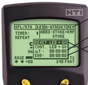
Internes Logging am AL1

Ermittle die Schallpegeldifferenz zwischen Emissionsort und Messort. Dieser Messwert muss bei der späteren Schallpegelaufzeichnung selbst mitberechnet werden