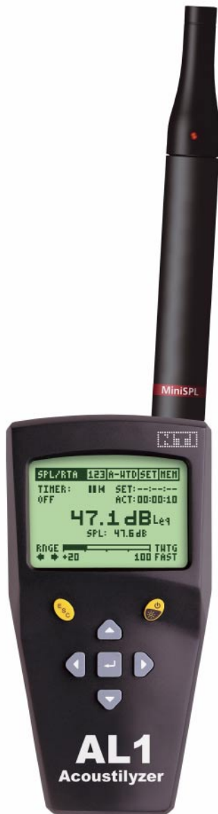
Schallpegelmessung mit Acoustilyzer AL1

Der Acoustilyzer AL1 zusammen mit dem MiniSPL Messmikrofon ist ein leistungsfähiges Messsystem, das der schweizer Schall- und Laserverordnung (SLV) entspricht. Dieses Dokument beschreibt die durchzuführenden Messungen laut der SLV, 2007.