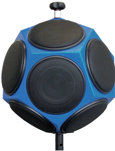
DS2 12面体スピーカー とオプションのスタンド

DS2 12面体スピーカーセットは、建築音響測定向けにパワフルなテスト信号を提供します。テスト信号はISO 16283とISO 3382規格に準拠してイコライズされ、高出力な音響エネルギーを最適化された周波数スペクトラムで放射します。