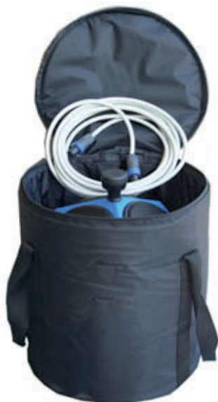
DS2 12面体スピーカー用 キャリングバッグ