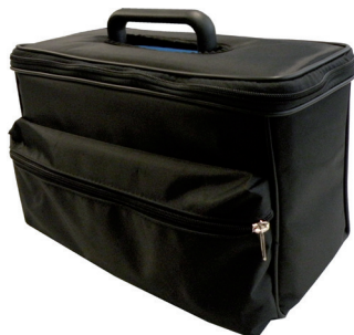
PA2パワーアンプ用 キャリングバッグ