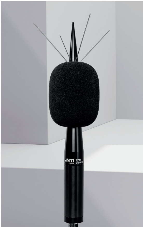
Aussen-Messmikrofon WP40-90 mit Stativ und ASD-Kabel

Die Aussen-Messmikrofone bieten eine wettergeschützte Messlösung für unsere Schallpegelmesser und ermöglichen die Erfassung von Umgebungslärmdaten bei Aussenanwendungen. Das korrosionsfreie Polymergehäuse, der Windschutz, die waserabweisende Membran und der Vogelschutzspitze bieten hervorragenden Schutz vor Regen, Wind, Staub und Vögeln.